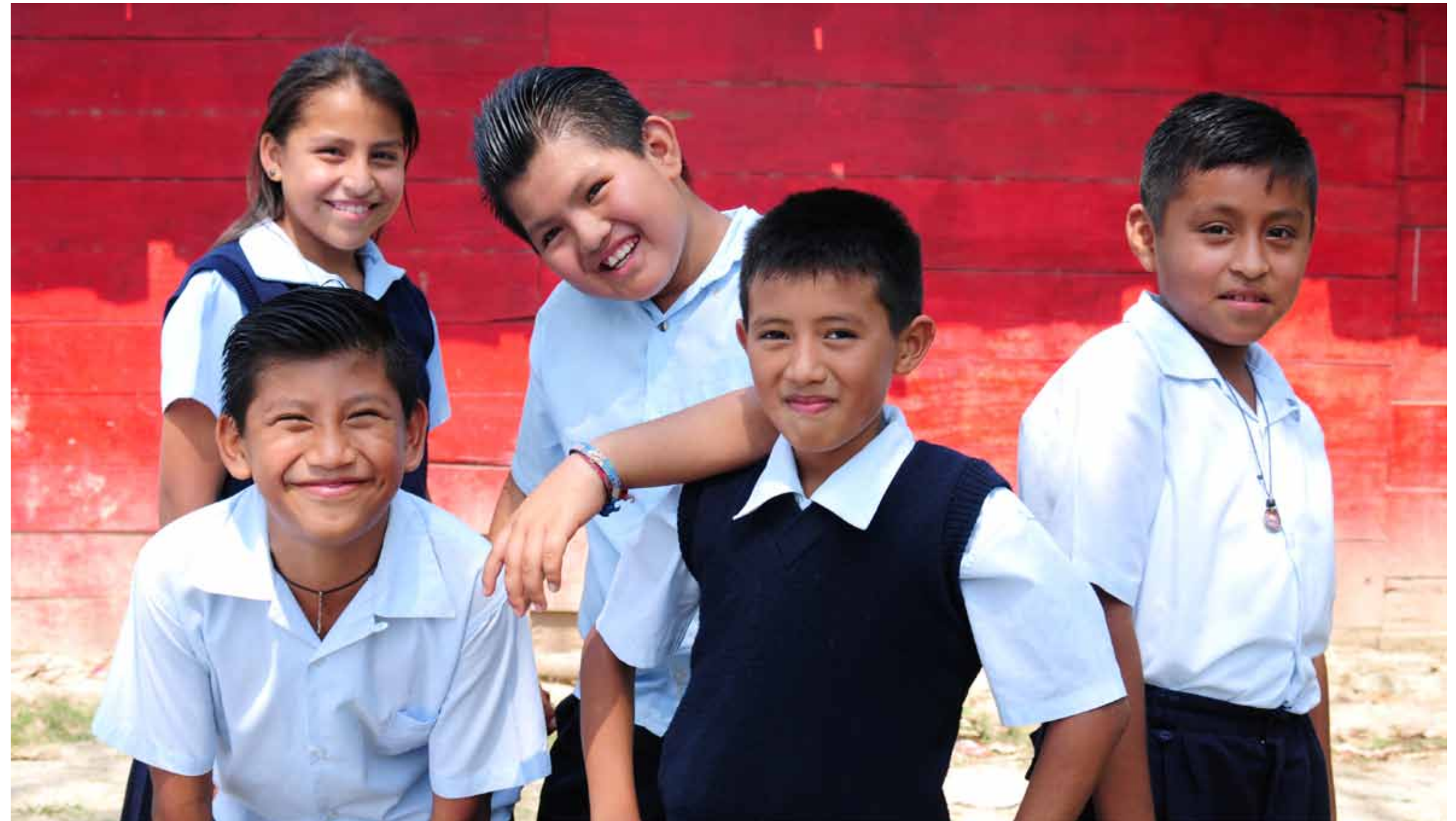
Poza Rica, Veracruz

Asimismo, con el objetivo de abastecer a industrias y comercios localizados en zonas alejadas a la red de ductos y así impulsar el desarrollo industrial en el país, el 24 de agosto de 2011 Pemex-Gas y Petroquímica Básica y el Gobierno del Estado de Sonora firmaron un convenio para transportar gas natural comprimido por auto-tanques. Con lo anterior se espera reducir costos y emisiones de contaminantes.