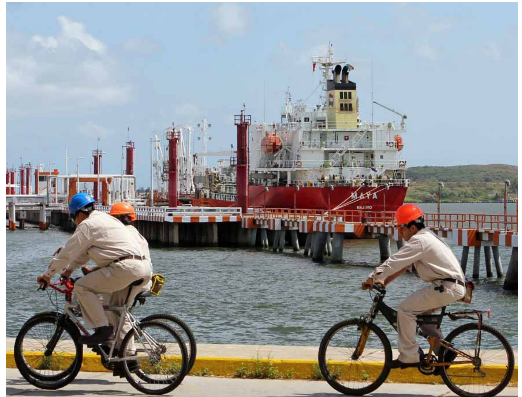
Terminal Marítima Pajaritos, Coatzacoalcos, Veracruz

Por otra parte, debido a problemas en los tratamientos de efluentes del SNR que por calidad impiden la reutilización de agua, en 2011 la proporción de reúso de agua con respecto al uso total se ubicó en 16.7%, menor en 0.37 puntos porcentuales comparado con el 17.1% reportado en 2010.